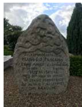
Døbefonten var smykket med flotte billeder og midtfor en fascinerende drage. Minder var der mange af. Ude på kirkegården står Niels Hansen Jacobsens mindesten for folkemindesamleren. I skolegården blev der arbejdet intenst med navneskilte