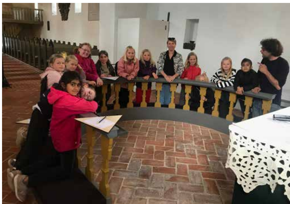
Vi kiggede efter søjler som de snoede på prædikestolen og lavede navneleg, hvor hver sagde sit navn og fortalte et minde.